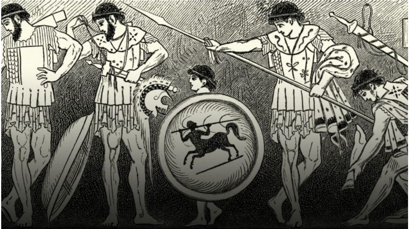
Duncan 1890 / Getty Images