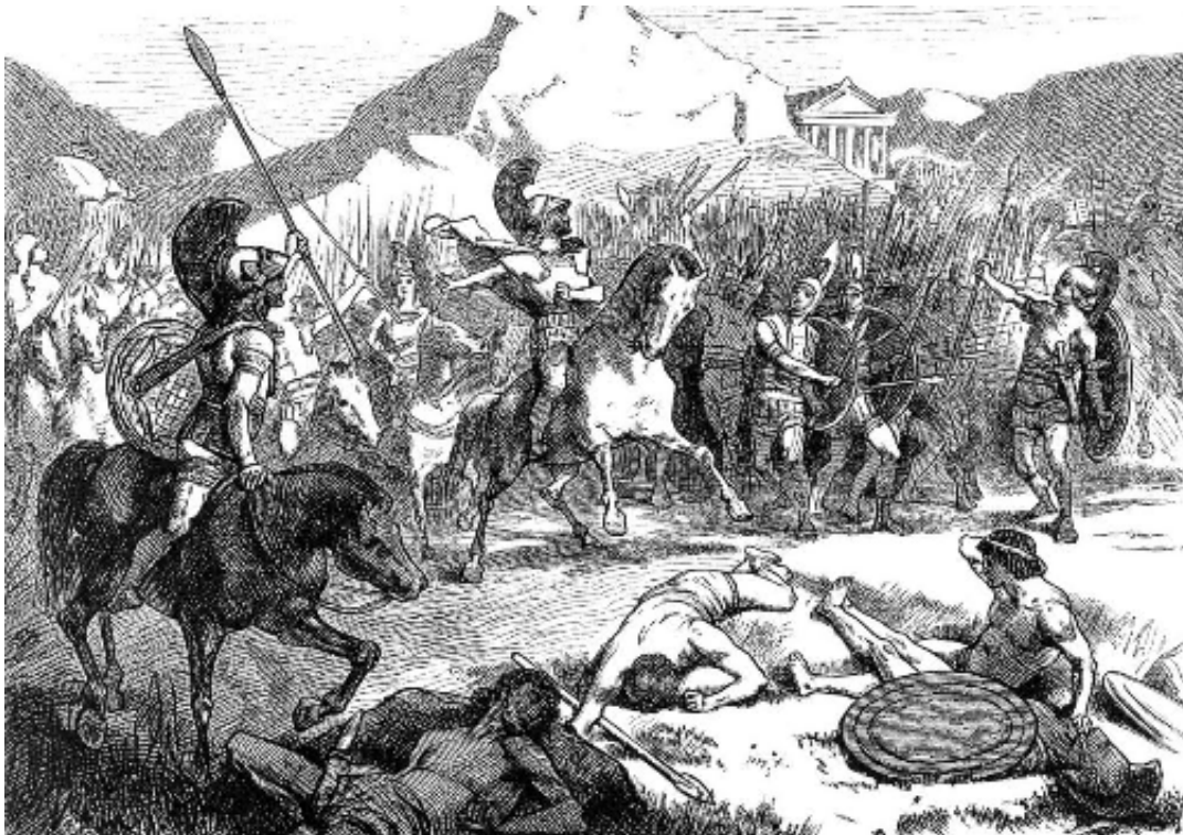
Formazione ad Echelon di Epaminonda, nella battaglia di Leuctra.