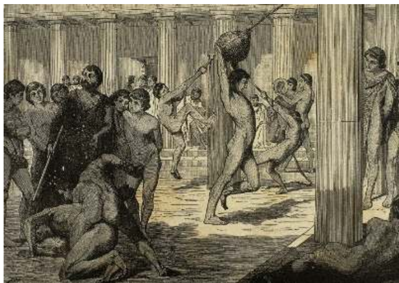
Young Spartan sportsmen training.