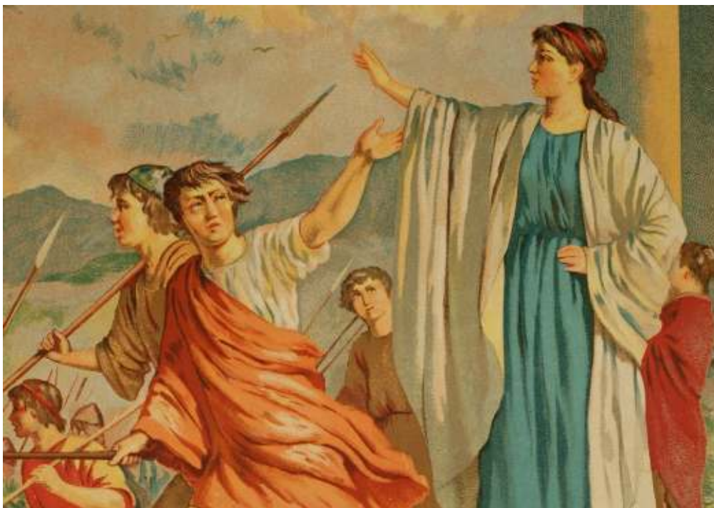
A Spartan woman saying goodbye to her young son who is going off to war.