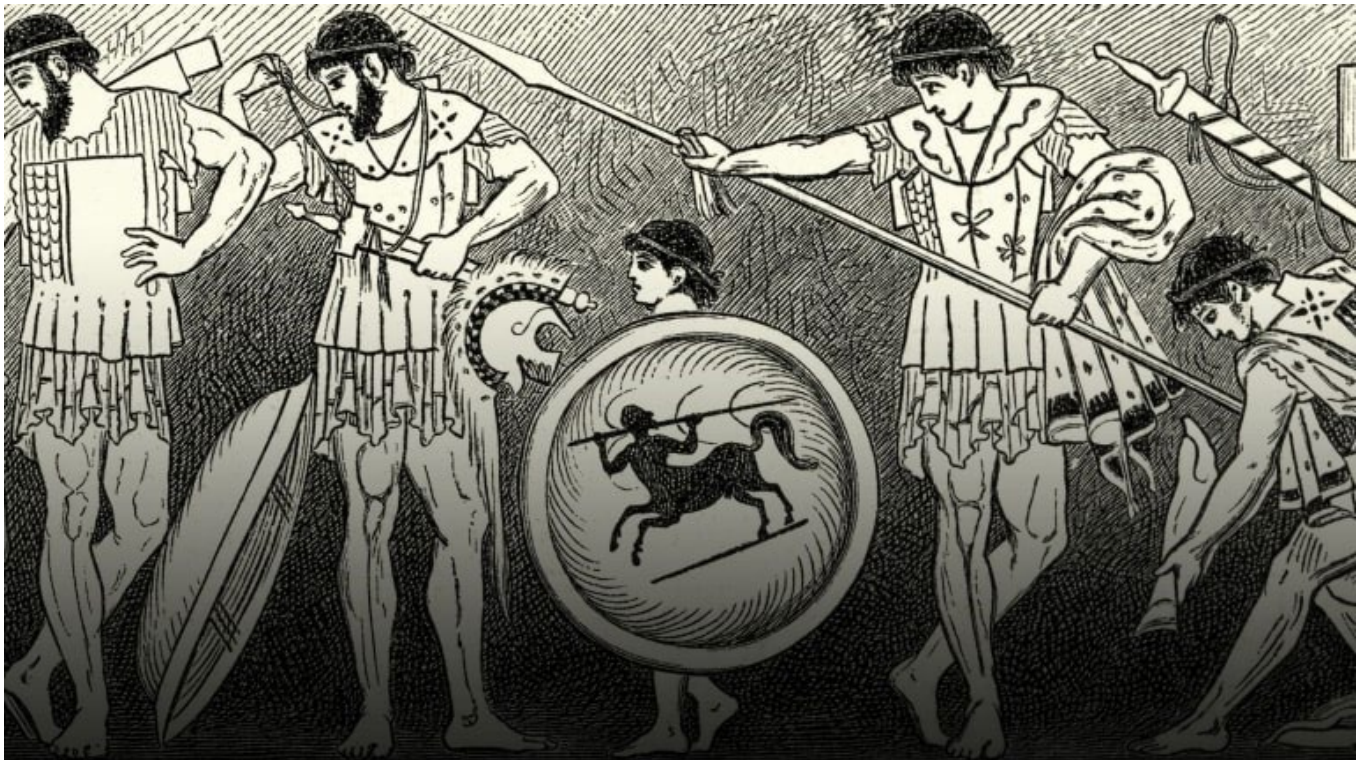
Duncan 1890/Getty Images