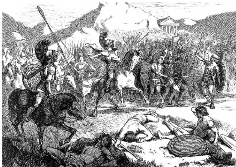
Epaminondas' Echelon formation in the Battle of Leuctra.