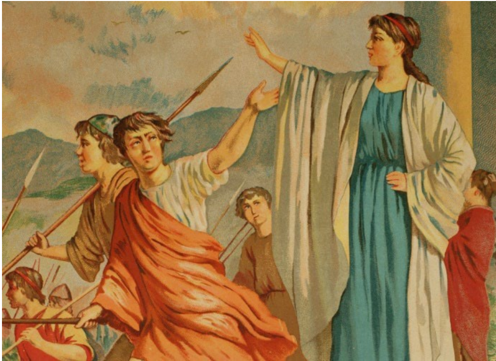
Una donna spartana che dice addio al suo giovane figlio, che sta andando in guerra.