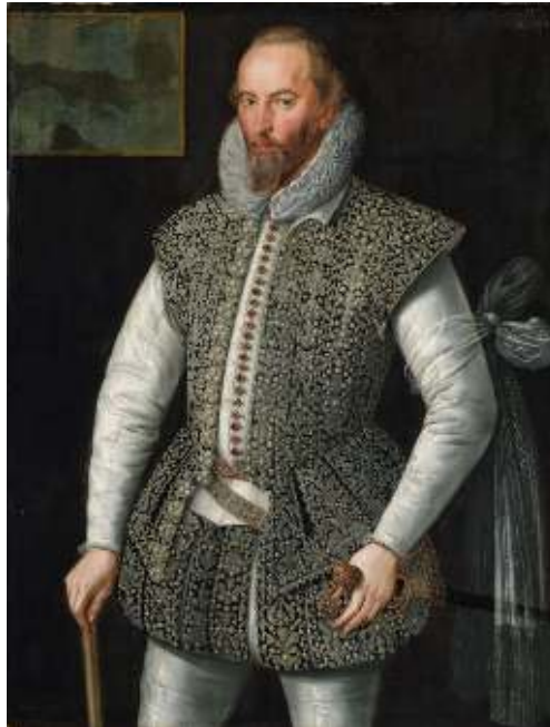
A contemporary portrait of Sir Walter Raleigh attributed to Sir William Segar (1564-1633).