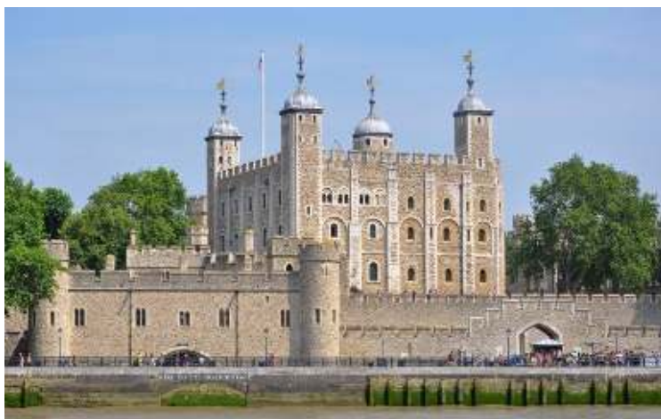
Walter Raleigh fu imprigionato nella Torre di Londra, in Inghilterra, dove infine fu giustiziato nel 1618.

La sua condanna fu sospesa, ma lui avrebbe trascorso i successivi 12 anni imprigionato nella Torre di Londra. Forse, questo ne acui l'ossessione, ma Raleigh non era l'unico a dividerla.