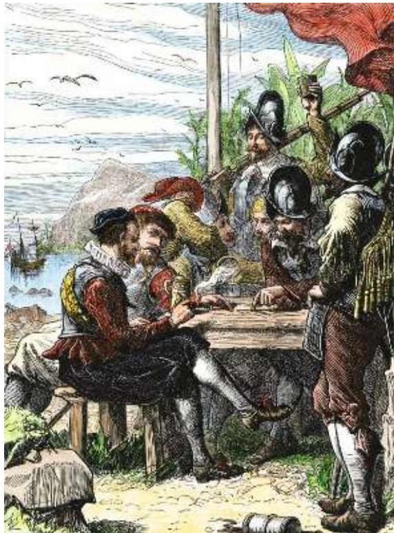
Walter Raleigh embarked on several expeditions in search of gold and glory

Berrio was in some senses Raleigh's principal rival, and that rivalry embodies a key truth about El Dorado for Raleigh. It was, of course, always about the gold. But fighting over that gold with Spain sharpened its importance: If Raleigh found El Dorado, he would be bringing England a fortune that would rival the flood of American treasure on which Spanish power gorged. Without that wealth, as Raleigh later pungently said, Spain's monarchy would be merely "kings of figs and oranges."