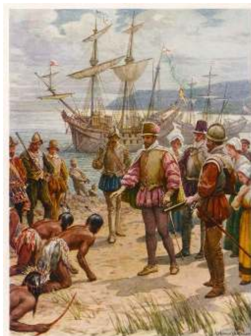
A fictional depiction of Walter Raleigh landing in Virginia

It was Raleigh, though, who ignited the story.