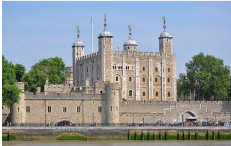
Walter Raleigh was imprisoned in the Tower of London, England, where he was eventually executed in 1618

In the autumn of 1603, Raleigh was convicted of plotting the overthrow of James I, who had ascended the throne earlier that year. His sentence was suspended, but he would spend the next 12 years imprisoned in the Tower of London. Perhaps that sharpened the obsession, but Raleigh wasn't alone in sharing it.