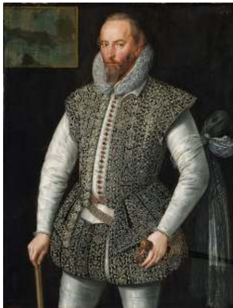
Un ritratto contemporaneo di Sir Walter Raleigh, attribuito a Sir William Segar (1564-1633).