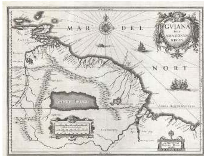
La mappa di Willem Janszoon Blaeu, relativa all'area nord-orientale del Sud America, il Lago Parima (Parime Lacus) e la rotta per El Dorado.

Due settimane dopo, ricevette una lettera da Keymis. "Non ho mai conosciuto il dispiacere, fino ad ora", scrisse in seguito Raleigh a sua moglie, riportandole la notizia.