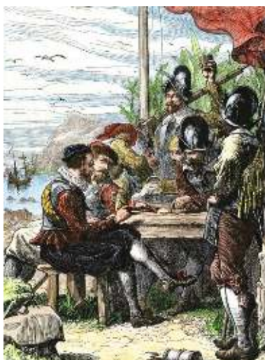
Walter Raleigh si imbarcò in diverse spedizioni, in cerca di oro e di gloria

Senza quella ricchezza, come disse Raleigh acutamente in seguito, la monarchia spagnola sarebbe stata semplicemente una "regina di arance e fichi".