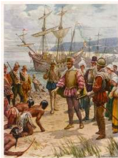
Una rappresentazione fittizia dello sbarco di Walter Raleigh in Virginia