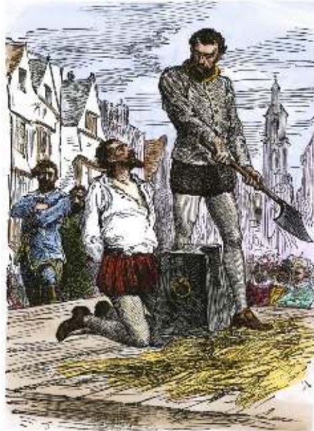
EXECUTION OF SIR WALTER RALEIGH.